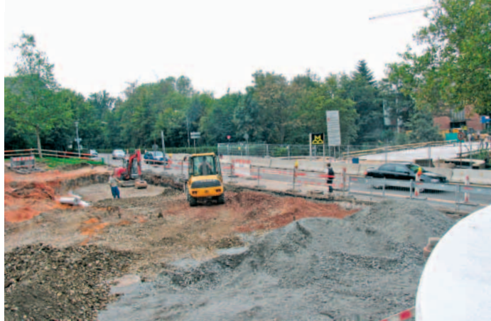
Die Bauarbeiten am Kreisel Mozartstraße und an der Mozartbrücke laufen auf Hochtouren. Leider werden sich in den kommenden Wochen entsprechende Verkehrsbehinderungen nicht vermeiden lassen.