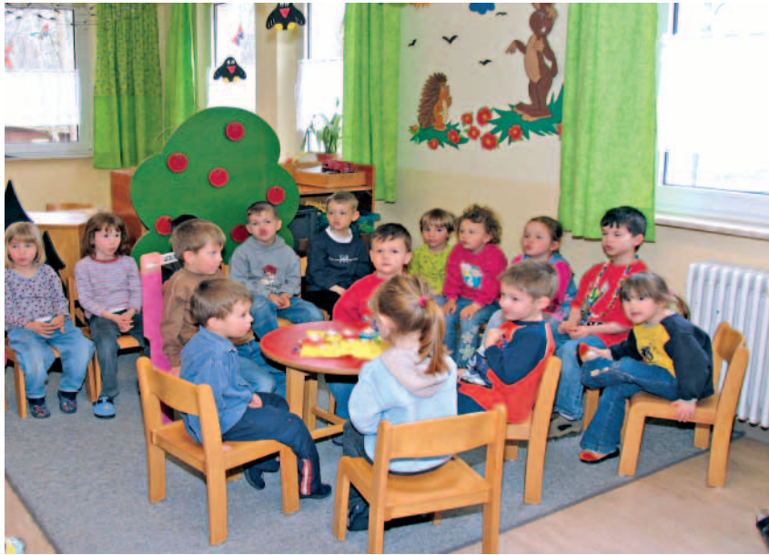
Auch in Zukunft soll es in Neunkirchen ein bedarfsgerechtes Kinderbetreuungsangebot geben.

Kinderbetreuungskonzept wird vorgestellt