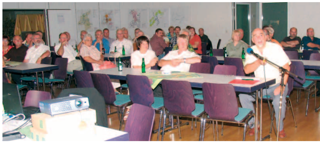
Wiebelskircher Bürger interessierten sich für Stadtentwicklungskonzept 2010/20