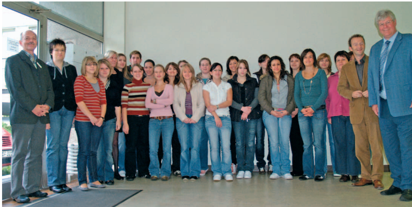
„Herzlich willkommen“: 20 neue Azubis im Städtischen Klinikum

Für den Ausbildungsberuf „Gesundheits- und Krankenpflege“ werden ab sofort Bewerbungen für Oktober 2008 entgegengenommen.