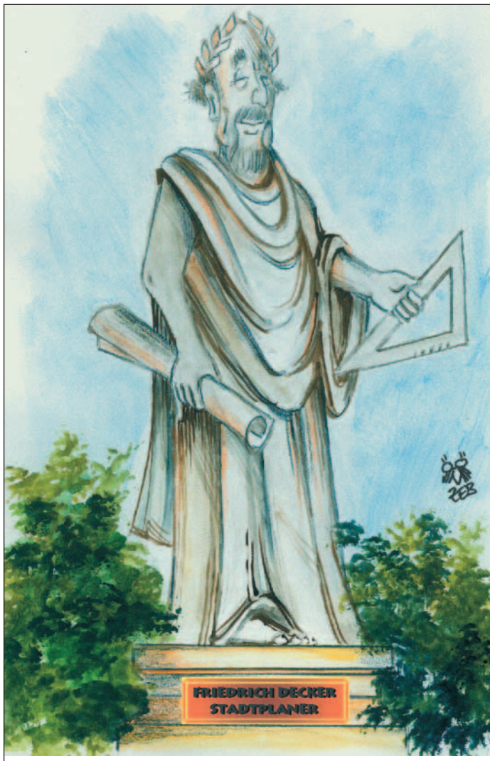
Denkmäler, die es (noch) nicht gibt!

Lob und Tadel Ehlers wird heute wohl anders gewichtet. „Die Stadt Neunkirchen ist reich an Denkmälern...“, schreibt Trepesch. Wir sehen das auch so und werden in einer Serie einzelne Denkmäler in Erinnerung rufen und ihre Geschichte und ihr Erscheinungsbild kurz skizzieren. Dabei kommen uns die Beiträge von Kunsthistoriker Christof Trepesch und auch Dr. Ehlen zu Hilfe. ■