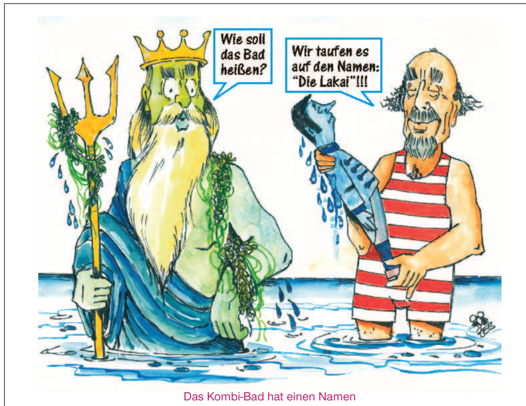
Das Kombi-Bad hat einen Namen