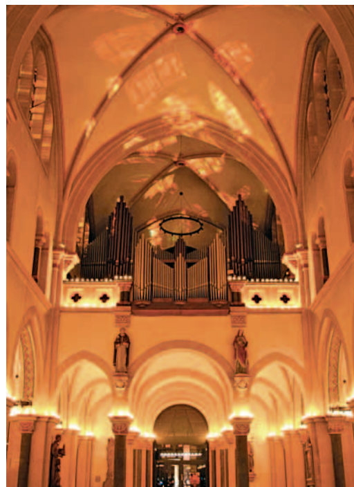
Weihnachtliche Atmosphäre in der Marienkirche

Karten zu 12 € gibt es im Vorverkauf an der Information im Rathaus und bei Bücher König in der Bahnhofstraße. ■