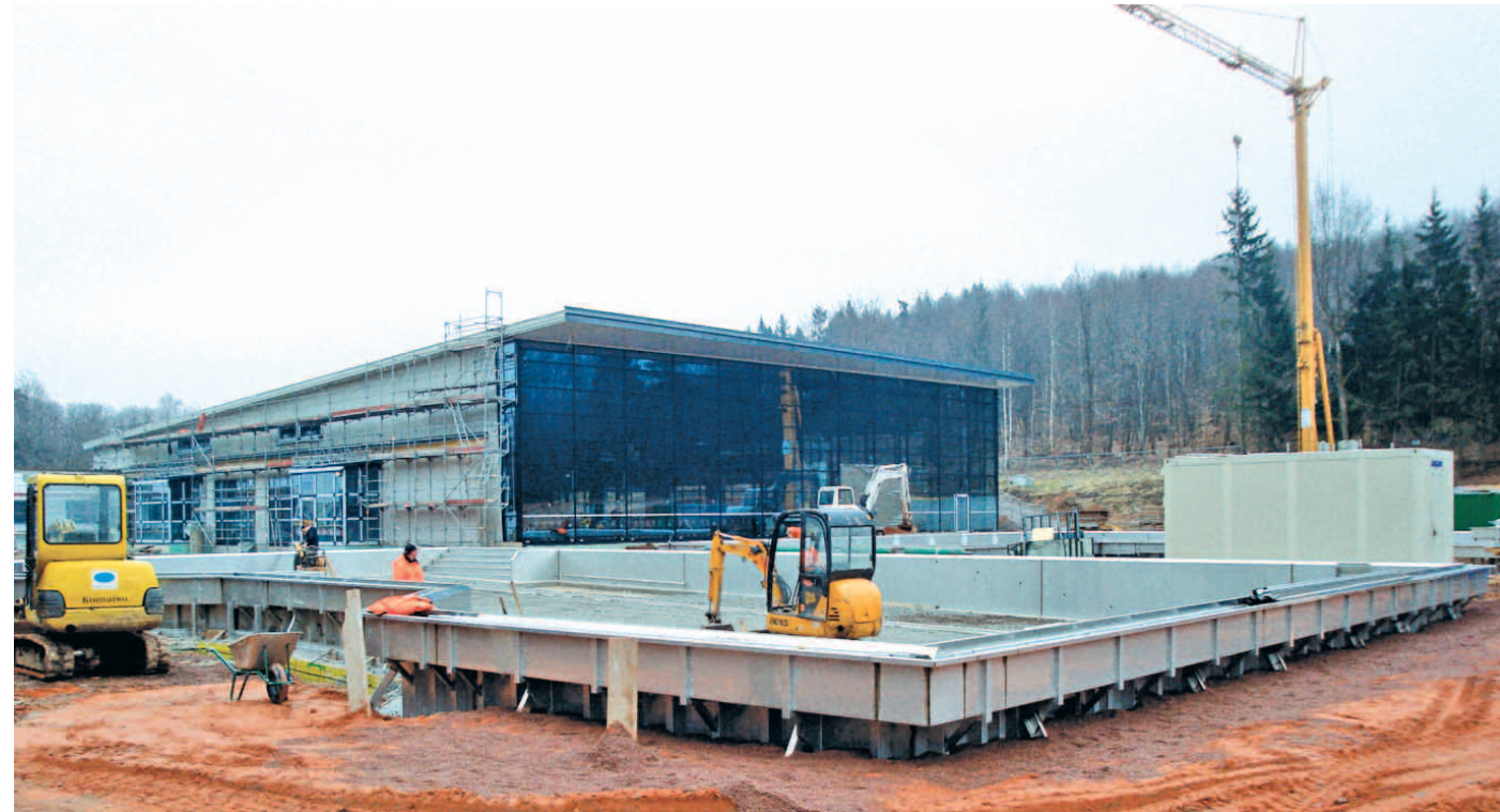
Die schlechte Witterung legte Arbeiten im Außenbereich vorübergehend lahm.

Dabei werden sich Frauen unter dem Leitmotiv „typisch deutsch? typisch türkisch?“ über Fragestellungen der Kindererziehung und des Familienlebens auszutauschen. Auf diese Weise kommen die Frauen