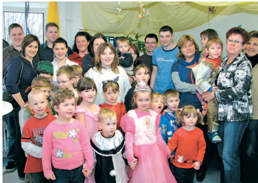
Kinder freuen sich über den Geldsegen vom TGBBZ.