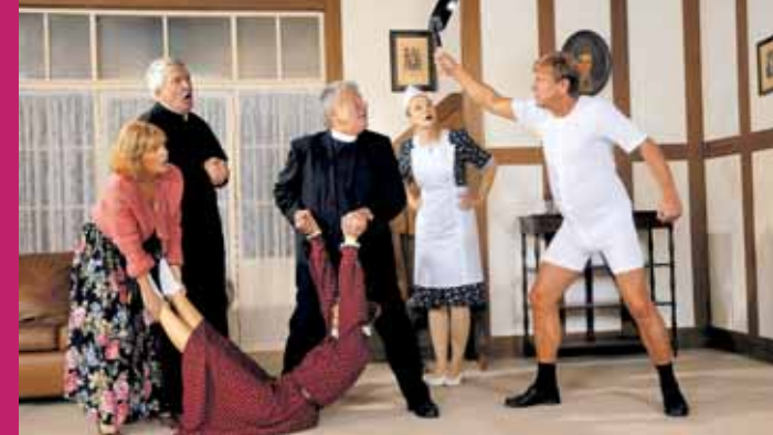
Szene aus „Lauf doch nicht immer weg“

Eintritt: Karten im II. Parkett VVK: EUR 15/8 Euro AK: EUR 17/10 Euro Vorverkauf bei CTS-Eventim In Neunkirchen bei NVG (Lindenallee), Wochenspiegel (Oberer Markt) Tickethotline: 0681-5 88 22222