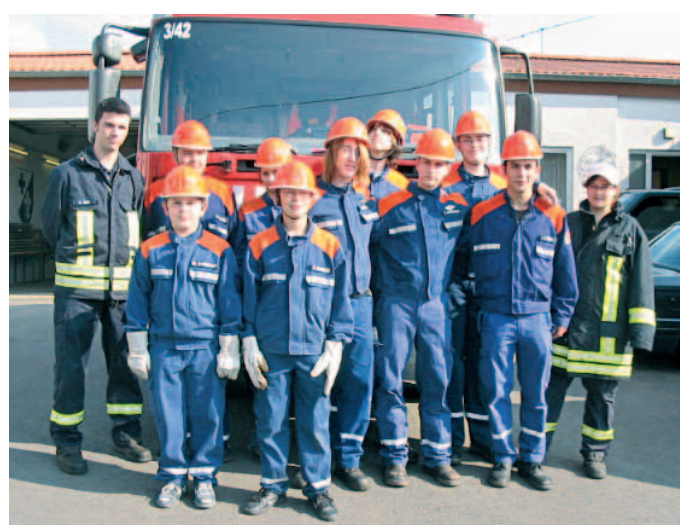
Ein starkes Team: Die Jugendfeuerwehr Münchwies