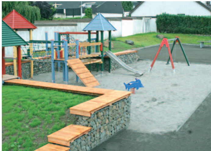
Ein echtes Schmuckstück für Kohlhof Kinder

Der sich anschließende Multifunktionsplatz ist für sportliche Aktivitäten wie Boule und Tischtennis, aber auch als nachbarschaftlicher Treffpunkt gedacht. Die Oberfläche des Platzes wurde als wassergebundene Decke aus Steinsand hergestellt, um eine ausreichende Festigkeit zu erreichen. Die Grünflächen wurden neu angelegt und mit Bäumen bepflanzt, um einen Alleincharakter zu erreichen. Ein Anlieger hat bereits seinen Teil zu der Neugestaltung beigetragen. Er hat die Rückwand seiner Garage neu gestrichen! ■