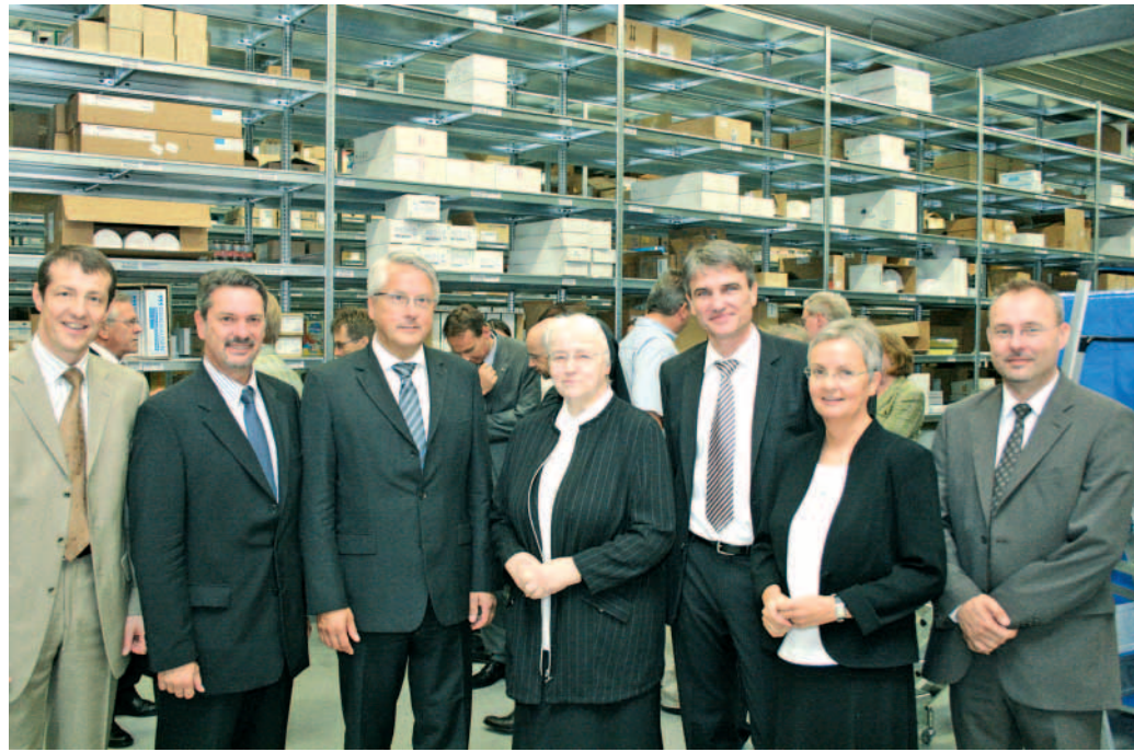
Neue Ansiedlung Support &amp; Service GmbH schafft Zufriedenheit

Das neue Logistikzentrum wird von Neunkirchen aus sukzessive alle saarländischen Krankenhäuser und Altenheime der Marienhaus-Gruppe im Saarland sowie