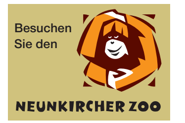
Besuchen Sie den NEUNKIRCHER ZOO