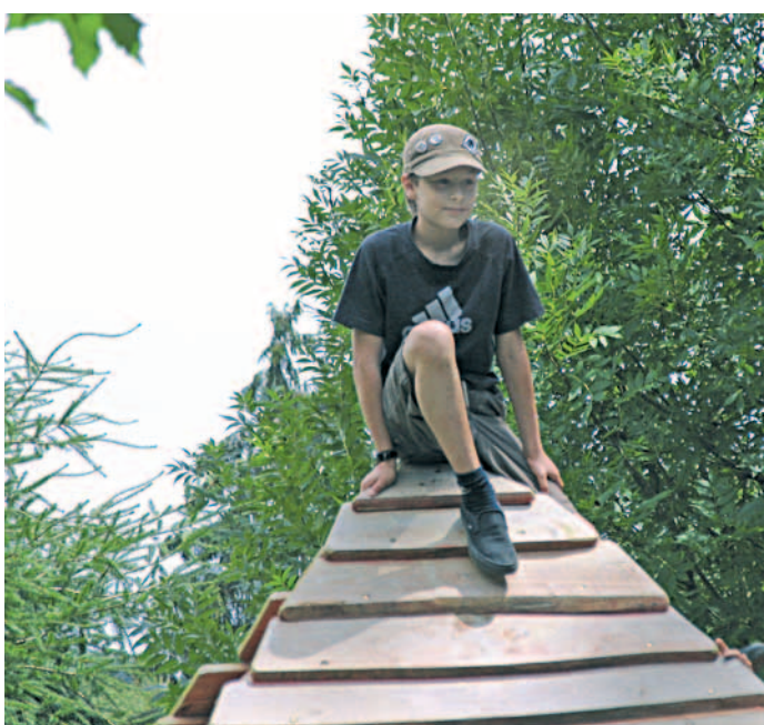
Mit Neunkircher Ferienaktionen ganz oben auf!

Das Programm findet man auch im Internet unter www.neunkirchen.de