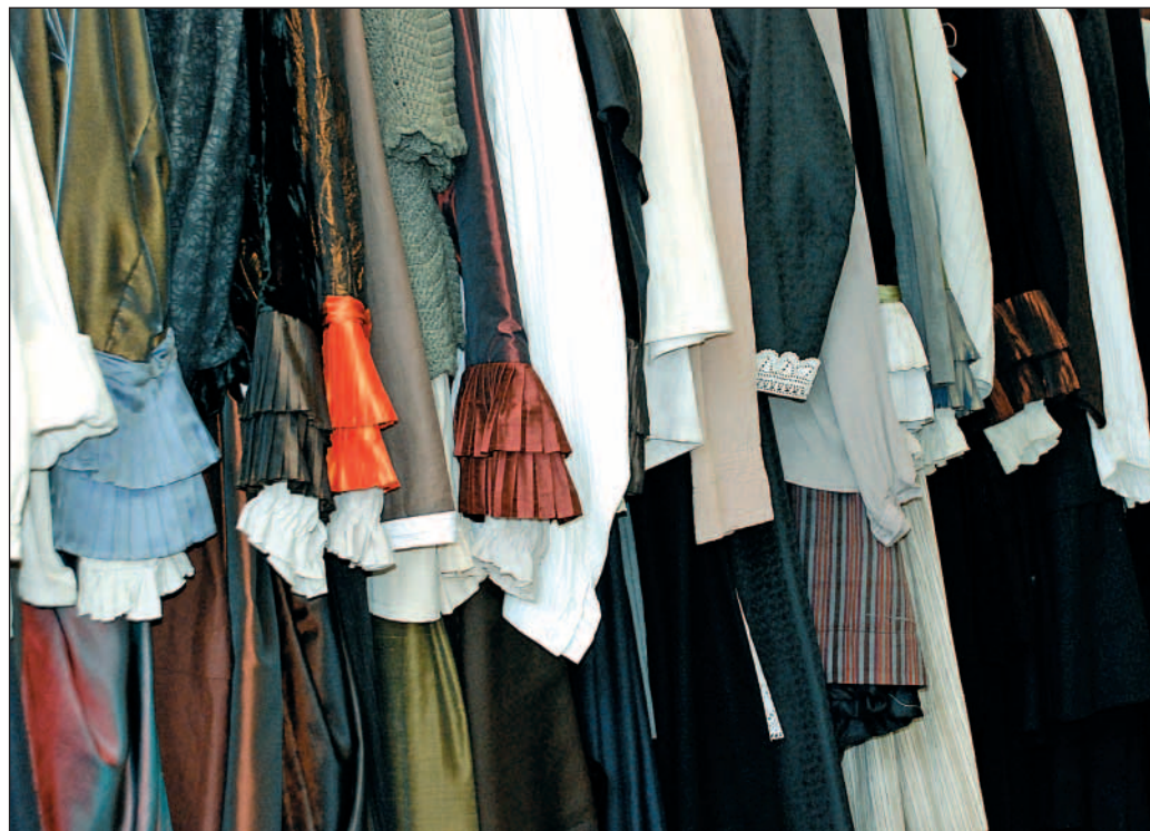
Stadtmomente: Kleider machen „STUMM“