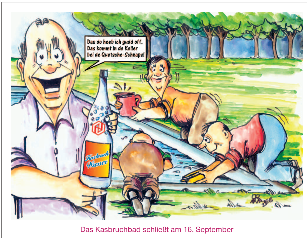
Das Kasbruchbad schließt am 16. September