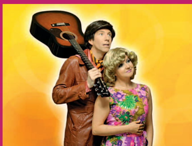
„Musik ist Trumpf“