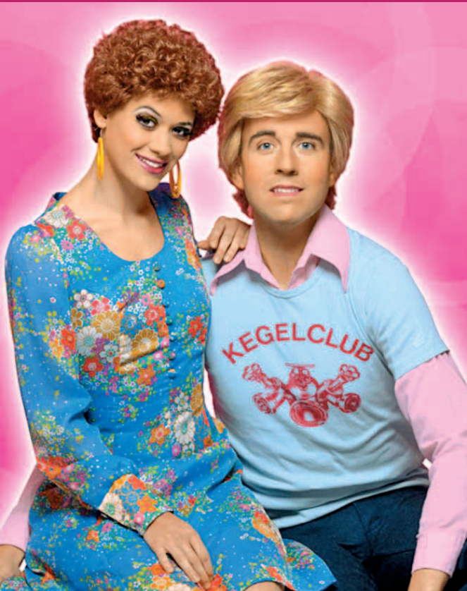
„Musik ist Trumpf“

Tickethotline: (0681) 5 88 2222 Die Plätze sind nummeriert.