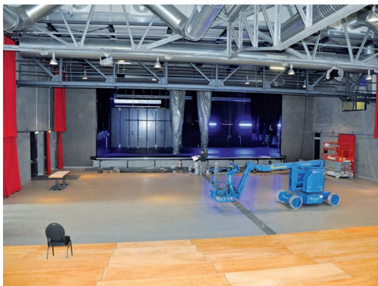
Gute Sicht auf die Bühne in der neuen Halle

Für unverlangt eingesandte Artikel übernimmt die Redaktion keine Haftung.