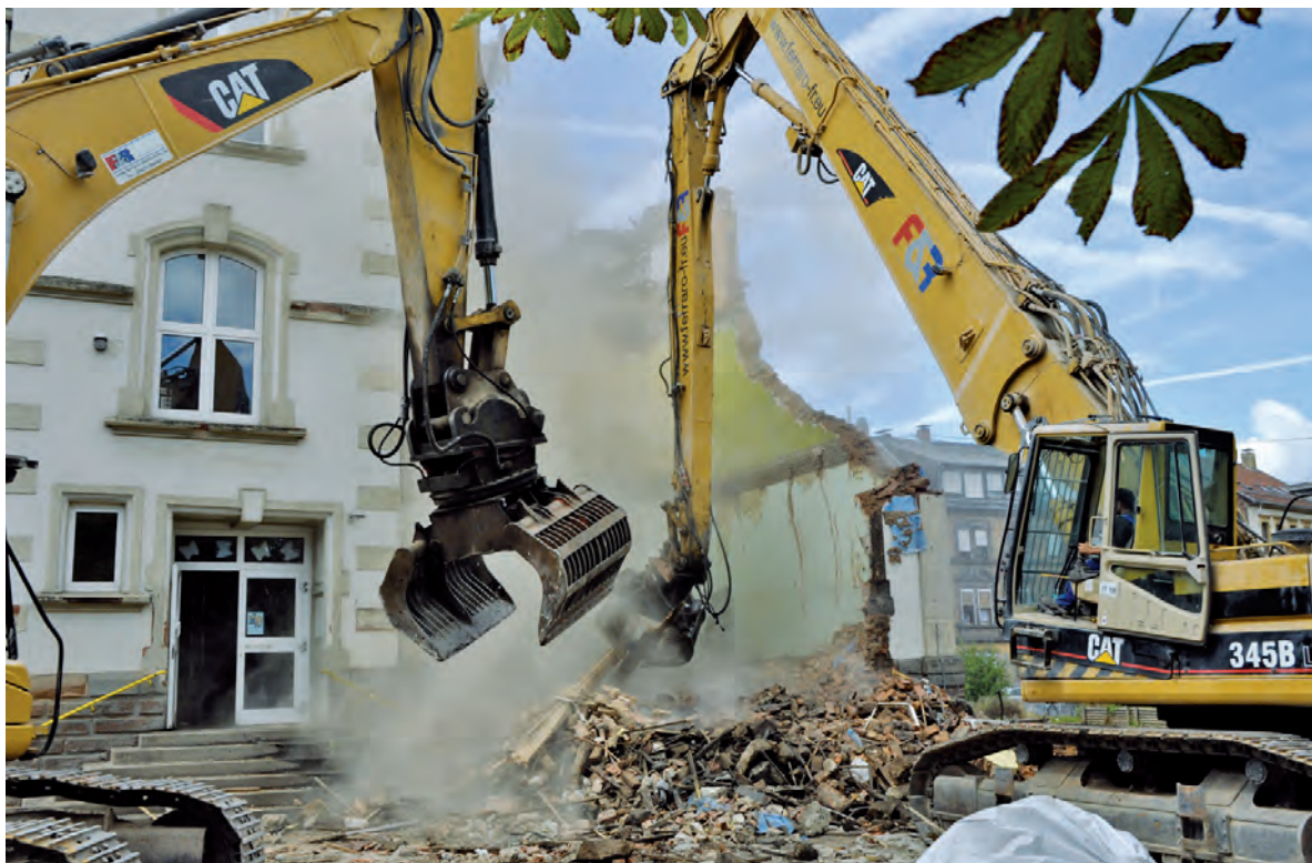
Und dann ging alles ganz schnell. Abriss in der Jägerstraße.