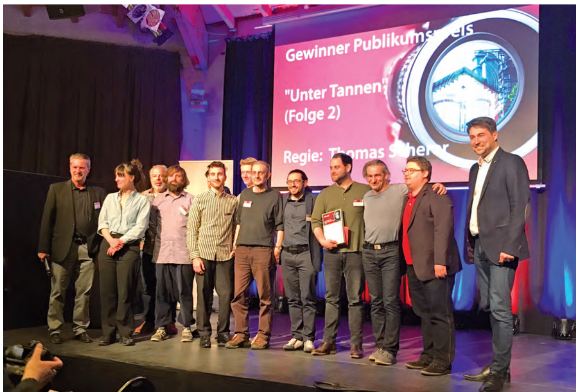
Oberbürgermeister Jürgen Fried durfte zahlreiche Filmschaffende in Neunkirchen begrüßen.

Für unverlangt eingesandte Artikel übernimmt die Redaktion keine Haftung.