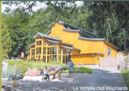
Le temple des éléphants