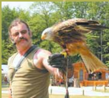
Vaut le détour: démonstration à la fauconnerie

Dans la « halle de la jungle », vous trouverez des pythons, des caïmans, des varans, ainsi qu'un grand nombre de poissons exotiques en aquarium, dont des poissons arc-en-ciel ou des piranhas. Dans l'aquarium marin trouverez-vous aussi des poissons clowns multicolores.