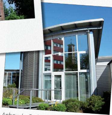
Anbau des Rathauses mit Trauzimmer