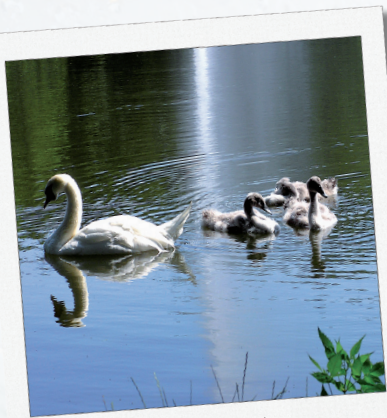
Idylle am Furpacher Gutsweiher