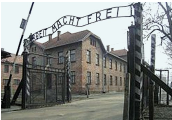
Gedenkstätte KZ Auschwitz, Eingangstor

(*) Eugen Kogon: „Der SS-Staat. Das System der deutschen Konzentrationslager“, Heyne Verlag, München 2006, ISBN 3-453-02978-X