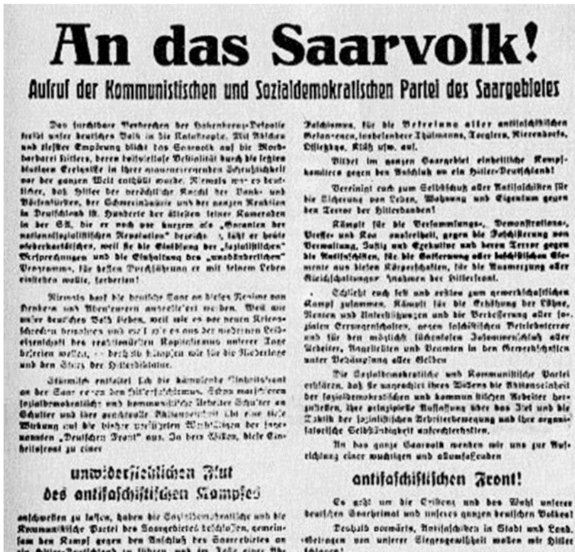
Faksimile „An das Saarvolk“

Nach dem Versailler Vertrag von 1919 war das Saargebiet für fünf Jahre vom Deutschen Reich getrennt und dem Völkerbund unterstellt. Danach sollte in einer Volksabstimmung über die weitere staatliche Zugehörigkeit entschieden werden. Bis auf eine kleine Minderheit lehnten alle Parteien und gesellschaftliche Organisationen diesen Status Quo ab und setzten sich ein für den Anschluss an Deutschland.