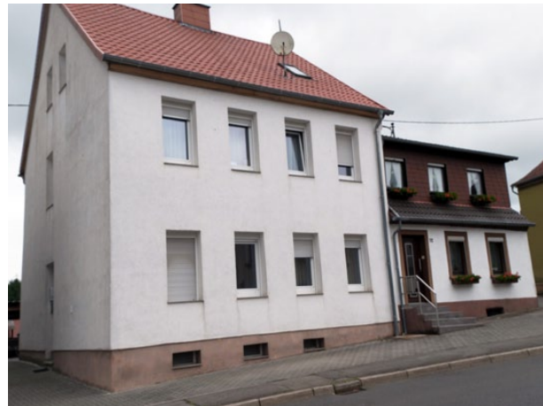
Wiebelskirchen, Bexbacherstraße 50