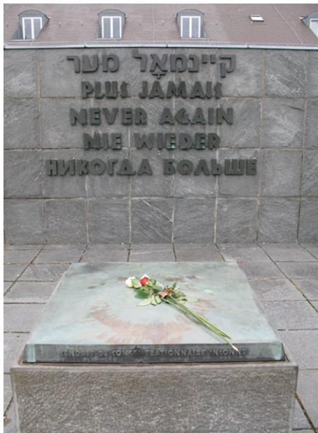
KZ Gedenkstätte Dachau

LeMO Der Zweite Weltkrieg - Völkermord - Konzentrations- und Vernichtungslager Auschwitz