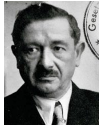
Hermann Petri Aufnahme um 1947

Stolpersteine verlegt Knappschaftsstraße 1