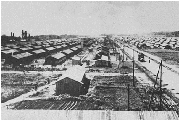
Internierungslager Camp de Gurs

Drancy, Stadt und Eisenbahnknotenpunkt, im Großraum Paris, nordöstlich; hier befand sich von 1941 bis 1944 das Sammellager Drancy. Dort wurden die Eisenbahnwaggons aus den verschiedenen Konzentrations- und Internierungslagern in Frankreich zusammengeführt mit den Menschen, die in die Vernichtungslager weitertransportiert werden sollten. Die Waggons standen tagelang auf dem Bahngelände, die Menschen eingepfercht, ohne Wasser und Essen, ohne draußen ihre Notdurft verrichten zu können. Von dort fuhren dann die Eisenbahntransporte in die Lager im Osten. Die Mehrzahl der in Frankreich internierten Juden, Roma und andere wurden über Drancy in die Vernichtungslager, hauptsächlich nach Auschwitz, deportiert.