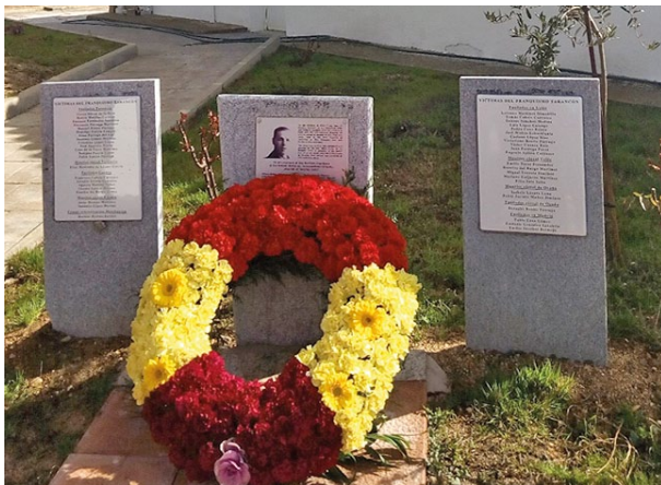
Gedenkstätte in Tarancó

Anmerkung: Angaben, bis wann das Office arbeitete konnte ich nicht finden. Mit dem Angriff Deutschlands auf Polen wurden die Exilanten aus Deutschland und Österreich interniert; spätestens dann dürfte das Office seine Tätigkeit eingestellt haben.