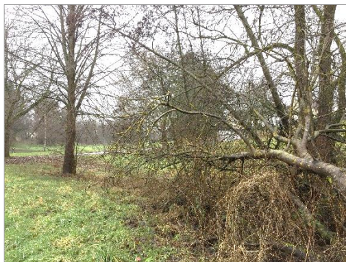
Abbildung 7: Ufersaum (4.14) mit liegendem Totholz im Vordergrund

Im Südosten des Plangebietes befindet sich ein Gehölzdominierter Ufersaum (4.14) . Dieser wird von einzelstehenden Bäumen geprägt, wie einer größeren Weide ( Salix spec. ), Schwarz-Erle ( Alnus glutinosa ) und einer (offensichtlich angepflanzten) Linde ( Tilia spec. ). Im Unterwuchs kommt u. a. Große Brennnessel ( Urtica dioica ) auf. Der Ufersaum geht fließend in die angrenzende Baumhecke über. Im Übergang befindet sich liegendes Totholz mit einem Stammdurchmesser von circa 40 cm.