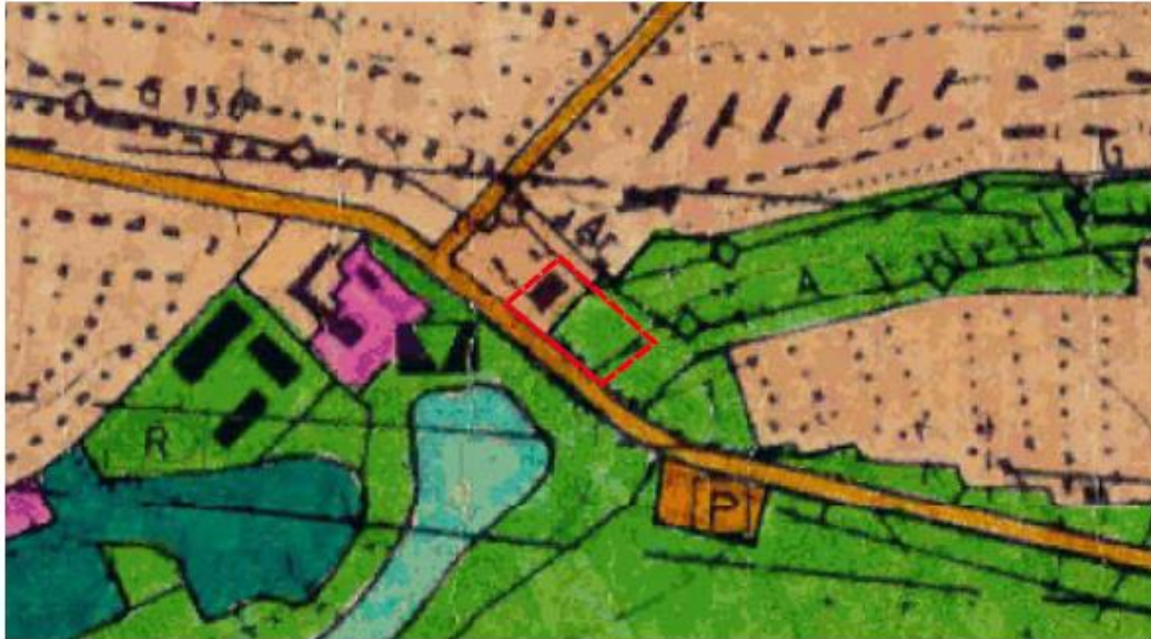
Abbildung 4: FNP (Bestand)