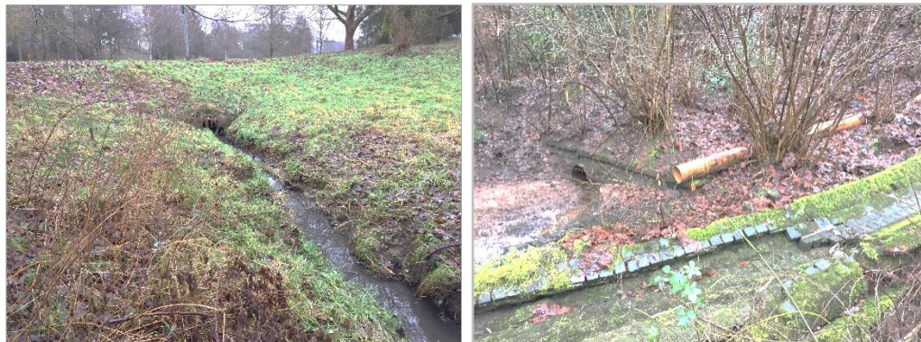
Abbildung 9: Bach (4.2) am südöstlichen Rand des Plangebietes (ARGUS CONCEPT)

Am östlichen Rand des Planbereiches befindet sich ein Bach. Dieser ist begradigt und sowohl unter dem Kohlhofweg und der Limbacher Straße verrohrt. Dabei wird er aus mehreren Rohren gespeist, welche unter der Limbacher Straße verlaufen (siehe Abbildung 9:). Im südlichen Bereich ist er befestigt. Nach Norden hin ist das Bachbett weitgehend unbefestigt. Es ist keine ausgeprägte, bachbegleitende Vegetation vorhanden. Das Ufer wird gesäumt von Gräsern und u.a. Großer Brennessel ( Urtica dioica ).