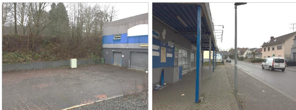
Abbildung 10: Vollversiegelte Flächen (3.1) im Geltungsbereich (ARGUS CONCEPT)

Über die Hälfte des Geltungsbereiches besteht aus einer vollversiegelten Fläche (3.1) . Es handelt sich hierbei zum einen um ein leerstehendes Geschäftsgebäude (ehemalige SB-Markt der Ruffing GmbH) und zum anderen um die Parkflächen. Die Parkflächen sind auf zwei Höhenniveaus unterteilt. Wobei der „untere“ Parkplatz in Abbildung 10 dargestellt ist. Zwischen den Parkplätzen sowie hinter dem ehemaligen Geschäftsgebäude befinden sich teilversiegelte Flächen (3.2) . Die sind mit sehr grobem Schotter aufgefüllt. Hier treten Ruderalarten auf wie u. a. Einjähriges Berufskraut ( Erigeron annuus )