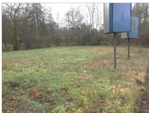
Abbildung 8: Wiese frischer Standorte (2.2.14.2) im südöstlichen Bereich des Plangebietes (ARGUS CONCEPT)

Bei den offenen Flächen im Plangebiet handelt es sich um eine ruderal geprägte Wiese frischer Standorte (2.2.14.2) . Diese wird gebildet von typischen Gräsern wie u.a. Wiesen-Knäulgras ( Dactylis glomerata ) und wenigen Kräutern wie z.B. Spitz-Wegerich ( Plantago lanceolata ), Wiesen-Labkraut ( Galium album ) und Wilde Möhre ( Daucus carota ). Der ruderale Charakter kommt u. a. durch das Vorkommen des Störzeigers Einjähriges Berufskraut ( Erigeron annuus ) zustande. Auf der Wiese befinden sich zwei Werbetafeln. Unter diesen ist der Anteil von Störzeigern deutlich höher.