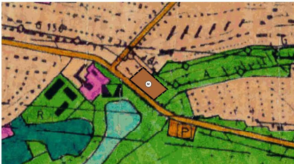
Abbildung 5: Geplante 21. FNP-Teiländerung