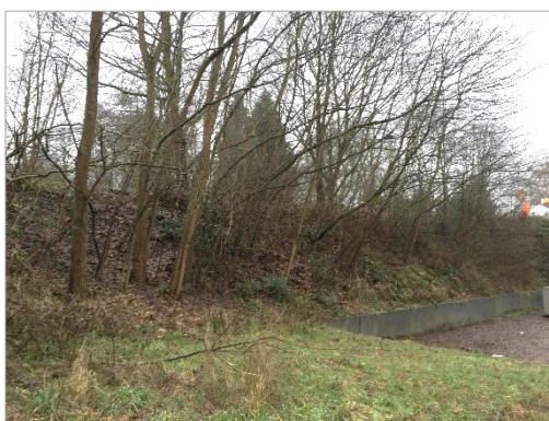
Abbildung 6: Baumhecke (1.8.3) im Südwesten des Planbereichs (ARGUS CONCEPT)

Im Südwesten des Plangebietes befindet sich eine Baumhecke (1.8.3) . Die Gehölze stocken auf einer nach Norden exponierten Böschung. Dominiert wird die Baumhecke durch Bergahorn ( Acer pseudoplatanus ) und Robinien ( Robinia pseudoacacia ). Am Randbereich kommt die Brombeere ( Rubus fruticosus agg.) vor. Im Unterwuchs kommen Frischezeiger auf, wie z. B. Echter Nelkenwurz ( Geum urbanum ).