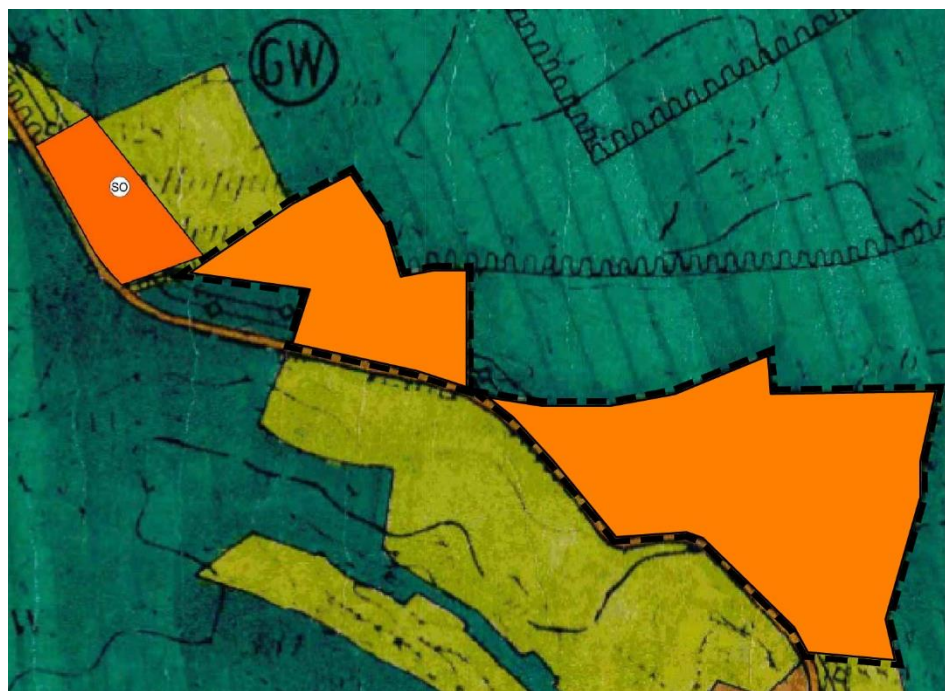
Abbildung: Darstellungen der geplanten Flächennutzungsplan-Teiländerung, genordet, ohne Maßstab

Die geplante Flächennutzungsplan-Teiländerung stellt eine Sonderbaufläche mit der Zweckbestimmung „Photovoltaik“ dar, damit der Bebauungsplan aus dem Flächennutzungsplan entwickelt werden kann.