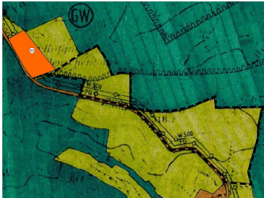
Abbildung: Darstellungen des wirksamen Flächennutzungsplanes, genordet, ohne Maßstab

Der wirksame Flächennutzungsplan stellt für den Geltungsbereich landwirtschaftliche Flächen dar.