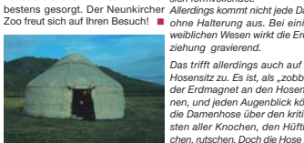
Die Jurte: Wohnen auf Kirgisisch.

Anlässlich des Sommerferienprogramms veranstaltet der Neunkircher Zoo am 17. Juli ab 10 Uhr ein kirgisches Fest in der Zoofalknerei. Einladend sind alle, die Spaß an traditionell kirgischer Musik und Tänzen haben und einmal die landestypischen „Jurten“ (Nomadenzelte) besichtigen möchten. Für das leibliche Wohl ist wie immer bestens gesorgt. Der Neunkircher Zoo freut sich auf Ihren Besuch!