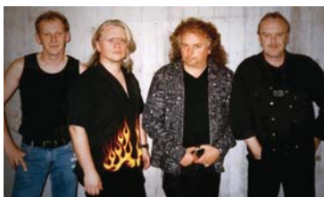
Die Blies Blues Band heizt am City Sommer ordentlich ein.

Am kommenden Donnerstag, 14. Juli, spielt von 18 bis 20 Uhr die Neunkircher Blies Blues Band. Nach langen Jahren spielt diese traditionsreiche Band wieder einmal in ihrer Heimatstadt. Am Samstag, 23. Juli, tritt das Tanzorchester Casablanca von 11 bis 13 Uhr auf. Der City Sommer Neunkirchen ist ein Veranstaltungsreihe des Stadteilbüros Mittelstadt über Gary