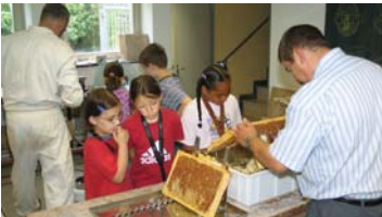
Prächtige Ausbeute: 54 Kilo Schillerschul-Honig.

Einen beachtlichen Ertrag konnte die Schillerschule Bienenföhrer. 27 Kinder der Bienen-AG der Schillerschule verbuchen: 54 Kilo Honig. Unter Anleitung eines erfahrenen Imkers wurden die Waben geschleudert. Seit zwei Jahren gibt es an der Schillerschule Bienenföhrer. 27 Kinder der Bienen-AG der Schillerschule verbuchen: 54 Kilo Honig. Unter Anleitung eines erfahrenen Imkers wurden die Waben geschleudert. Seit zwei Jahren gibt es an der Schillerschule Bienenföhrer. 27 Kinder der Bienen-AG der Schillerschule verbuchen: 54 Kilo Honig. Unter Anleitung eines erfahrenen Imkers wurden die Waben geschleudert. Seit zwei Jahren gibt es an der Schillerschule Bienenföhrer.