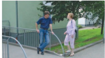
Die GSG begrüßt Mieterinitiativen