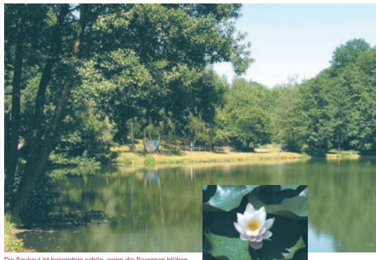
Die Saukaul ist besonders schön, wenn die Seerosen blühen.

Ob Sie den Saukaulweg von der nördlichen Seite des Saukaulweiher (Wasserfläche 15.600 qm) an der Oberen Saukaul kann der Wanderer 585 m auf den Bau von Hütten verzichten, um hier „die Weiherwelt so natürlich wie möglich zu erhalten“.