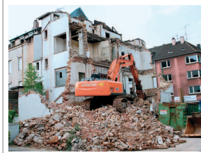
Der Fortschritt wird sichtbar beim Stadtbau West: Die Stadt hat das baufällige und einsturzgefährdete Gasthaus Hebenthal in der Wellesweilerstraße zum Abriss erworben. Wenn die Schuttmassen entfernt sind, entsteht eine Freifläche, die ggf. als Parkplatz genutzt werden kann.