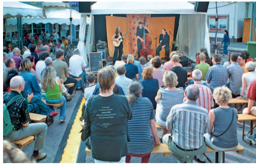
Für jeden etwas: Tolles Musikprogramm auf vier Bühnen

Weitere Infos im Internet unter www.nk-stadtfest.de