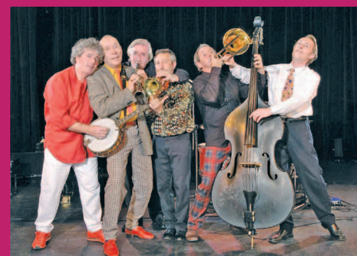
Les Haricots Rouges

„Les Haricots Rouges“ sind die Stars der Französischen Nacht im Hofgut Furpach. Dass Jazz nicht nur ein Genuss für die Ohren, sondern auch für die Augen sein kann, unterstreichen die sechs Roten Bohnen mit ihrer in Europa