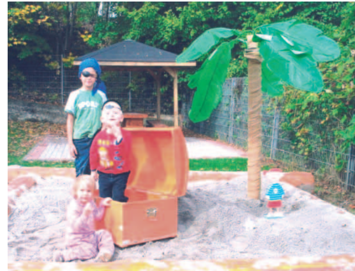
Alarm: Gefährliche Sandkasten-Seeräuber in der Hermanstraße