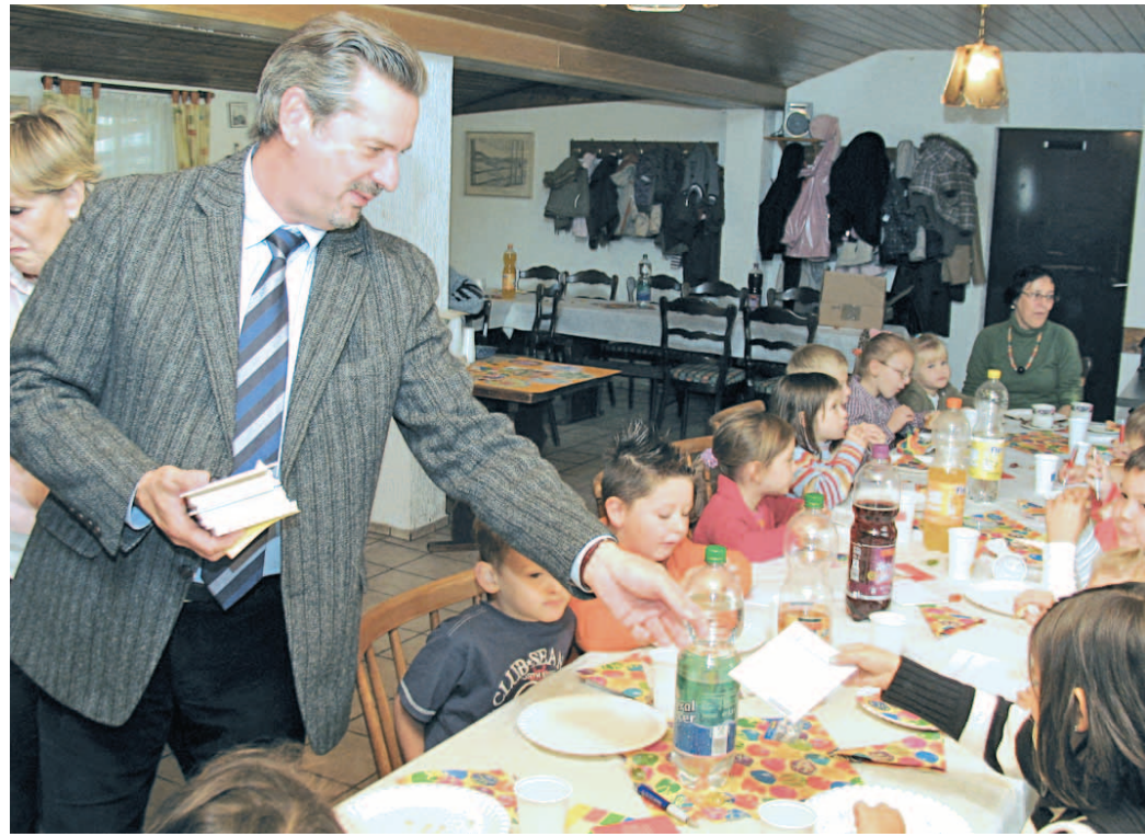
Kleine Geschenke erhalten die Freundschaft: OB Fried und Wellesweiler Kiga-Kinder

Dies freute OB Fried: „Ich danke den Wellesweiler Kleingärtnern, sowie den Sponsoren für ihr Engagement, den jüngsten Bürgerinnen und Bürgern dieses Natur- und Spielerlebnis zu ermöglichen. Eine solche Aktion sollte Vorbildcharakter für das Miteinander im Stadtteil haben“.