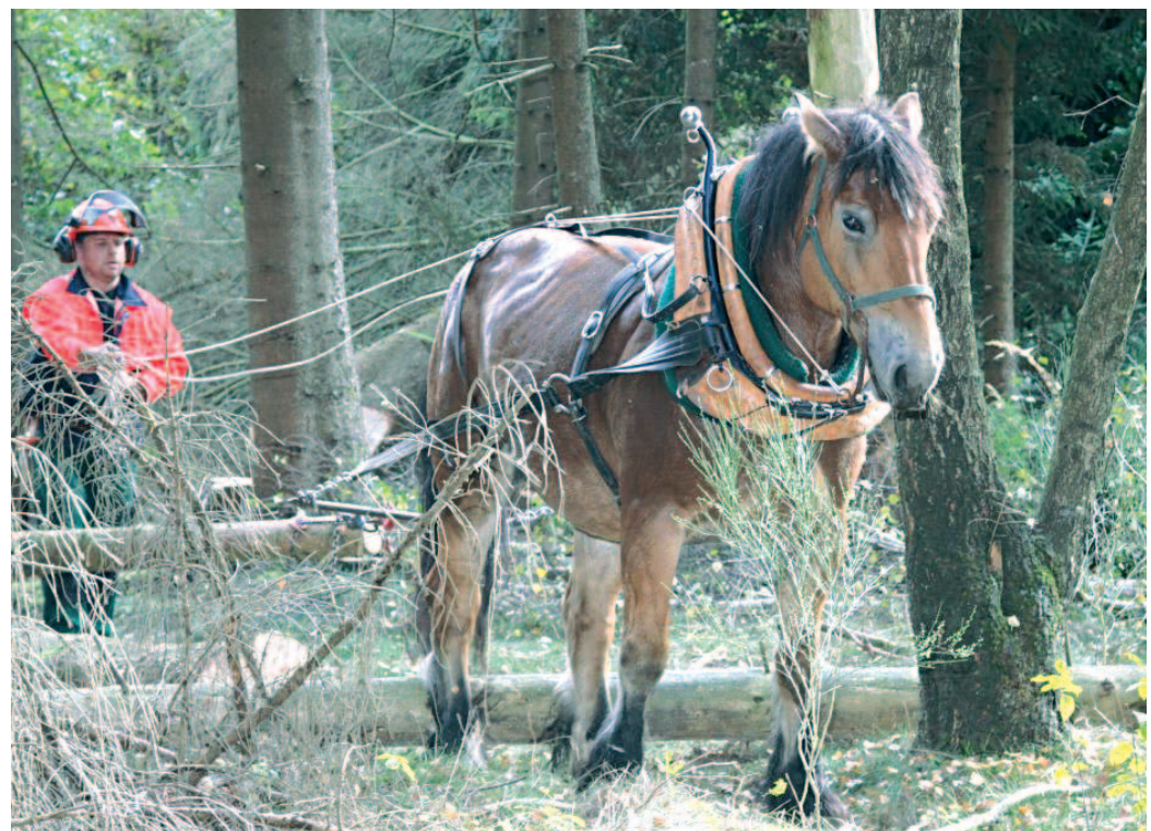
Wenn der ZBN Holz „abpferd“

In diesem Jahr werden zur Holz-ernte im Stadtwald erstmals Rückepferde eingesetzt. Ein Unternehmer aus Rheinland-Pfalz führt die Maßnahme, die vom Umweltministerium gefördert wird, gemeinsam mit den Forstwirten des Zentralen Betriebshofes (ZBN) durch. Es ist sehenswert, mit welcher Trittsicherheit und Kraft die Pferde ihre Arbeit leisten. Der Einsatz von Pferden ist umweltfreundlich. Die kräftigen Tiere, die bis zur