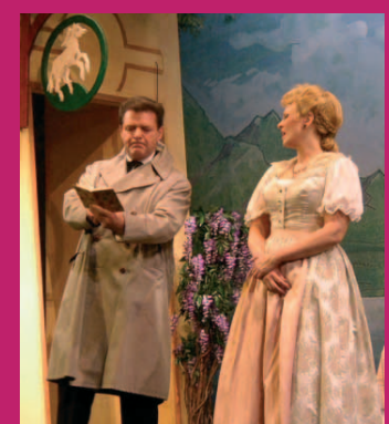
Szene aus „Im weißen Rössl“