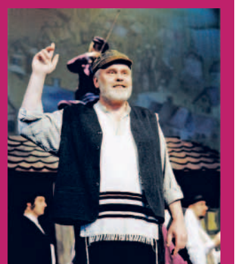
Szene aus „Anatevka“