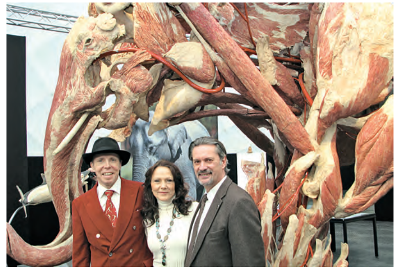
Bei der Körperwelten-Ausstellung