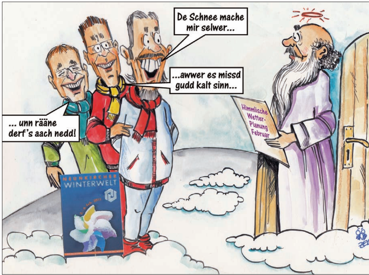
Das Wetter zur Neunkircher Winterwelt - Petrus soll es richten

Auch einen Besuch der Kinder-tagesstätte im Winterfloß will der Ortsrat in nächster Zeit durchführen.