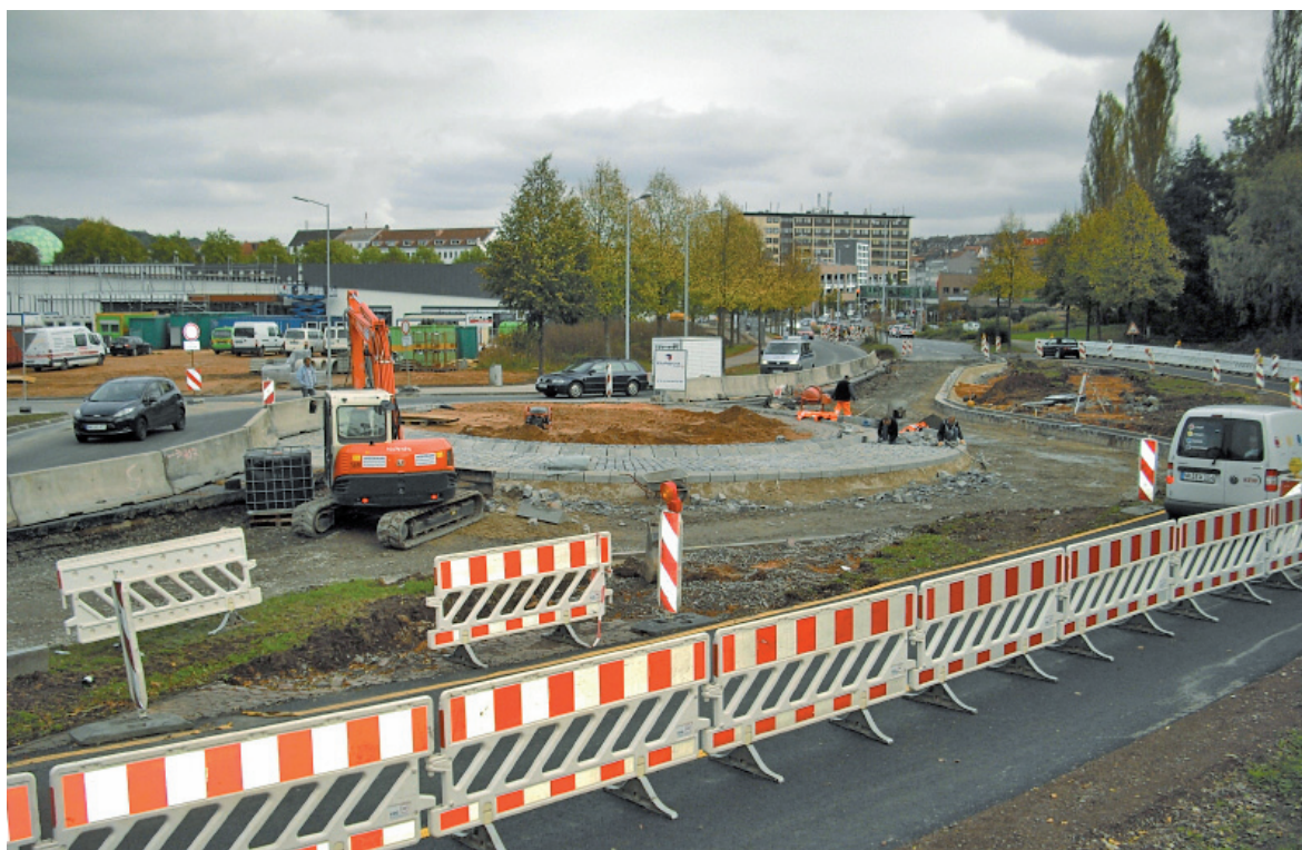
In der Lindenallee entsteht ein neuer Kreisverkehr.