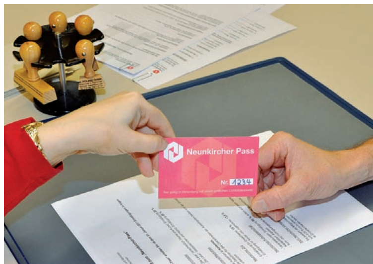
Mehr Teilhabe durch den Neunkircher Pass

wird bei Vorlage des Neunkircher Passes keine Nutzungsgebühr erhoben; nur eventuell anfallende Mahngebühren bleiben. Die Eintrittspreise für den Neunkircher Zoo reduzieren sich für Erwachsene um 15%, für Kinder und Jugendliche um 12,5%. Um den Zugang zu Kultur- und Bildungsangeboten zu erleichtern, beteiligt sich auch die Neunkircher Kulturgesellschaft: Auf Veranstaltungen gibt es 25 %, auf VHS-Kurse ebenfalls 25% und auf das Angebot der Musikschule sogar 30% Preisnachlass. Karten müssen telefonisch reserviert werden. Zusätzlich zum Neunkircher Pass kann eine Ermäßigungskarte der NVG (saarVV Card) beantragt werden. Mit der Karte zum Preis von 5 € kann man verbilligte Einzelfahrtscheine kaufen. Je nach Preisstufe der Fahrkarte spart man zwischen 0,30 € und 1,70 €.