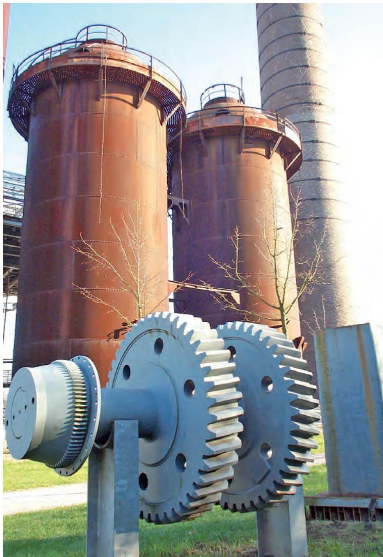
Relikte der Eisenhütte erzählen Geschichte.

Für unverlangt eingesandte Artikel übernimmt die Redaktion keine Haftung.