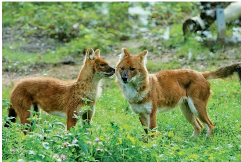
Zuschuss für „tierische Bürger“ in Neunkirchen

Für unverlangt eingesandte Artikel übernimmt die Redaktion keine Haftung.