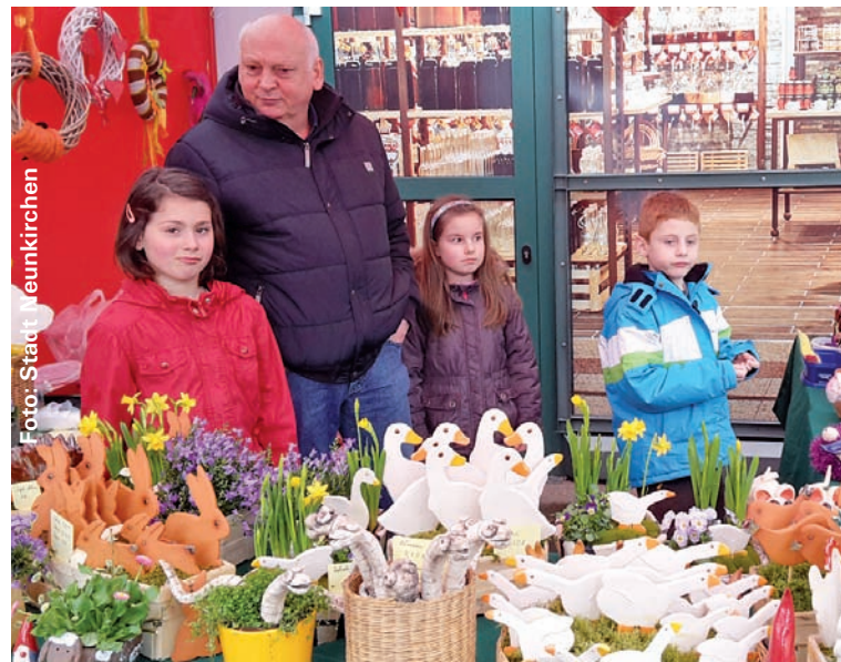
Buntes Angebot beim Neunkircher Frühling