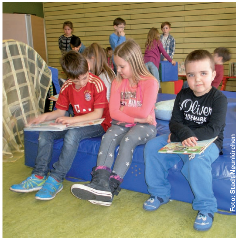
„Die blaue Matte“: Junge Literaturkritiker in Neunkirchen

Die Schulkinder genossen es dabei sichtlich, mal „die Großen“ zu sein und vorzulesen. Auch die Kindergartenkinder hatten viel Freude an dem Treffen und konnten beim gemeinsamen Frühstück neue (Lese-)Freundschaften knüpfen. Die Ausstellung in der Kindertagesstätte bietet in jedem Jahr sowohl den Kindern als auch ihren Eltern die Möglichkeit, neue Kinderbücher zu entdecken und dann auch gemeinsam zu lesen. Es kann davon ausgegangen werden, dass sich so manches ausgestellte Buch auch auf dem Wunschzettel für den Osterhasen wieder finden wird.