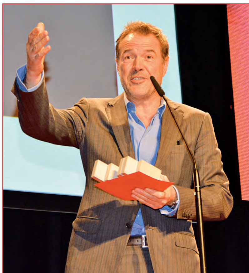
Sebastian Koch, „Nebel im August“