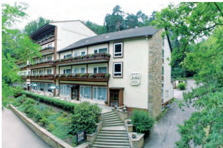
Hotel-Pension Seeblick in Bad Bergzabern