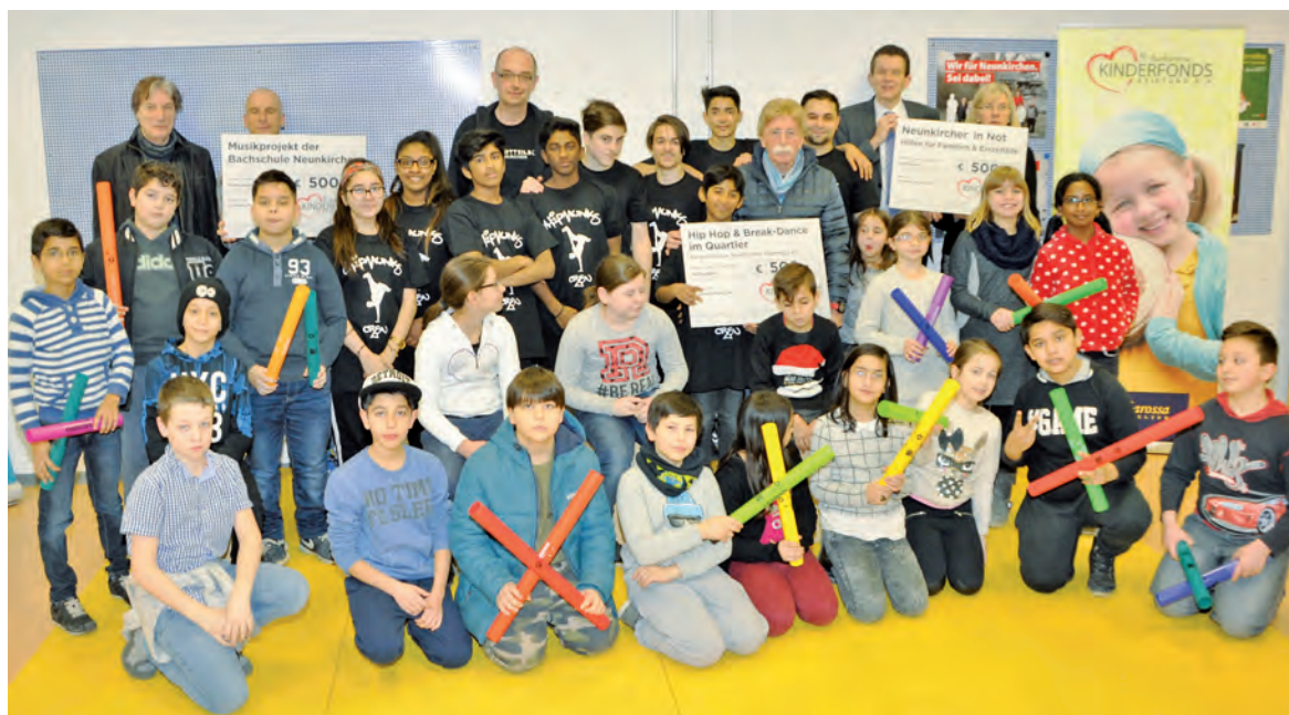
Die Barbarossa Kinderfonds Stiftung unterstützt drei Projekte.