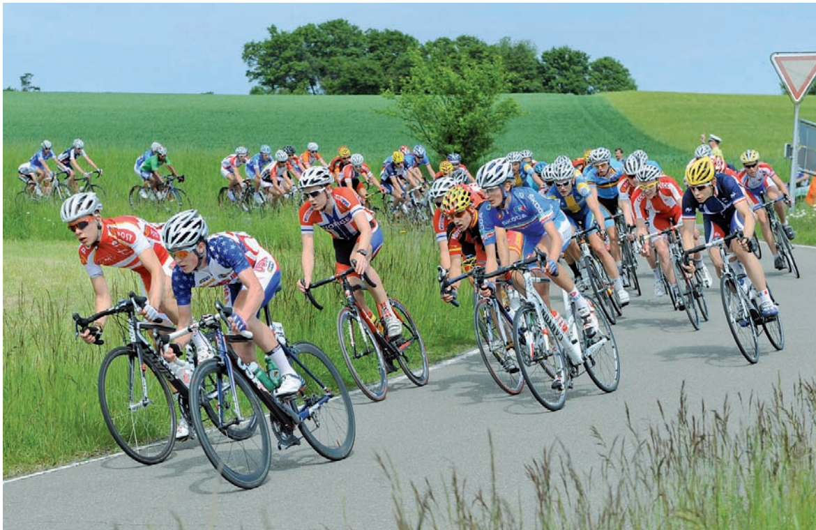
Junge Radrennfahrer bei international renommierter Rundfahrt