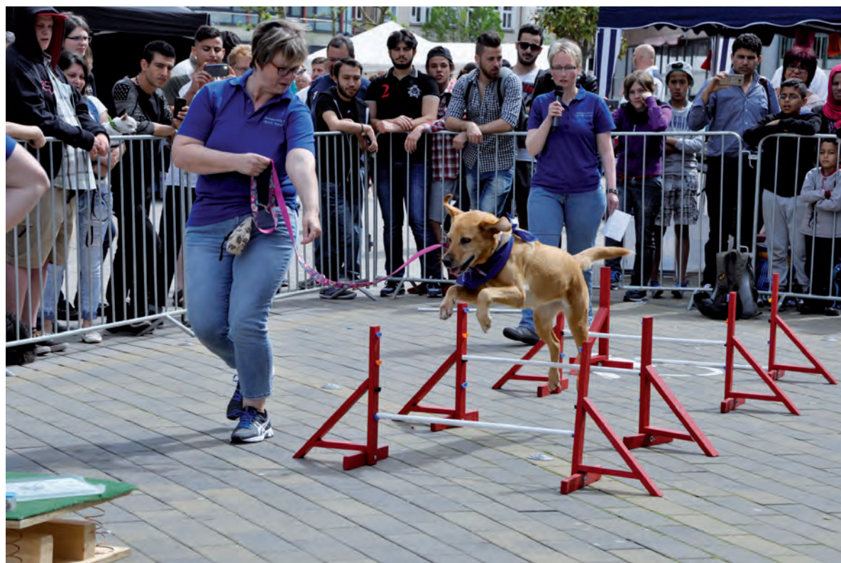
Hundefreunde können Tiere in Aktion erleben